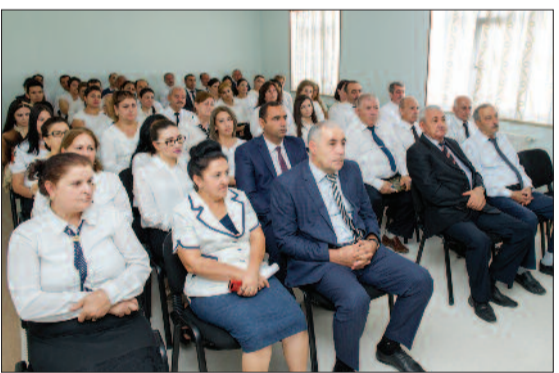
Naxçıvan Müəllimlər İnstitutunda 2017-2018-ci illərin payız-qış mövsümünə hazırlıq və qarşıda duran vəzifələrlə əlaqədar tədbir keçirilib.